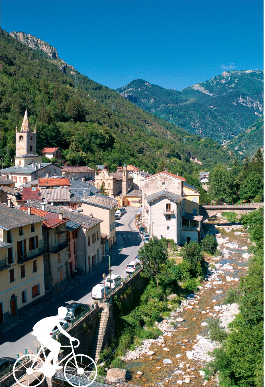
La Brigue