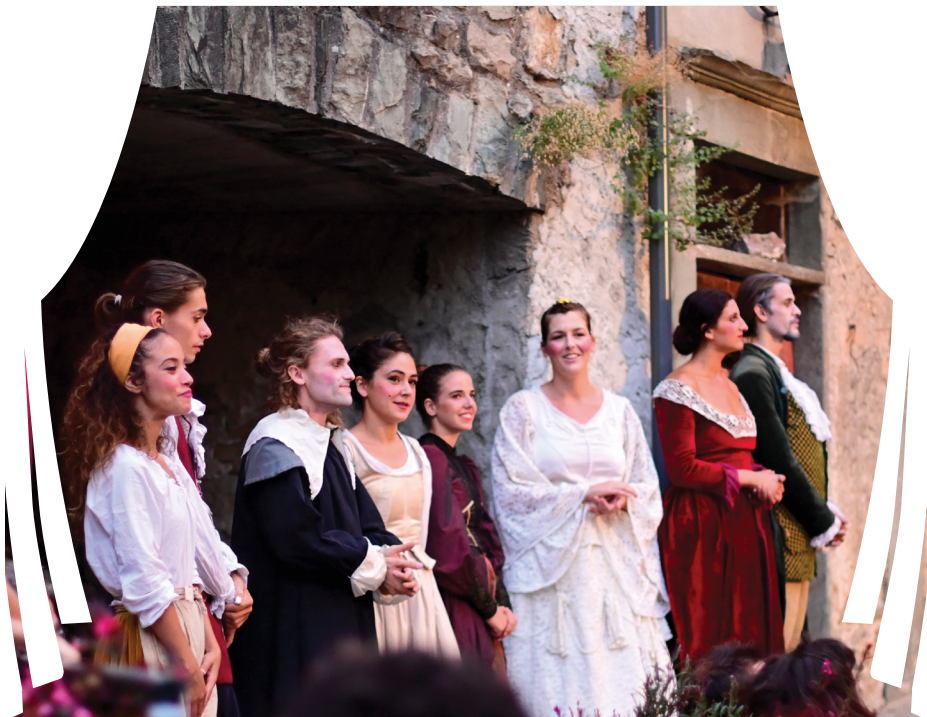
Théâtre de la Commedia Dell'arte à Tende 2022