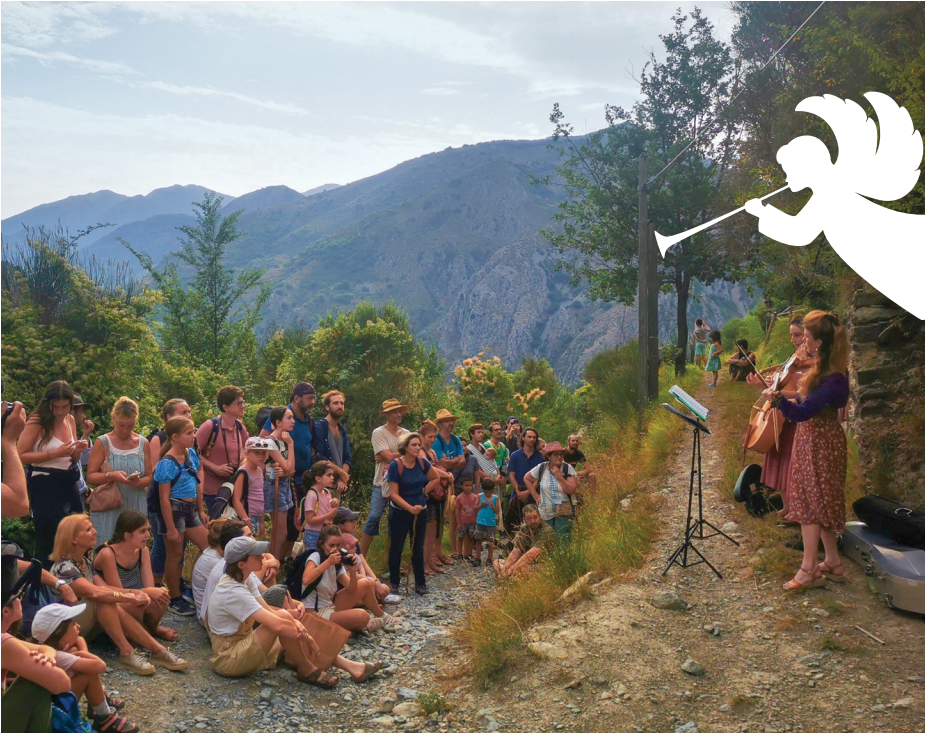
Les musiciens du Festival