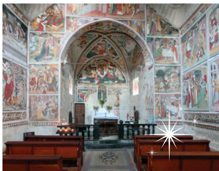
Chapelle Notre Dame des Fontaines, La Brigue