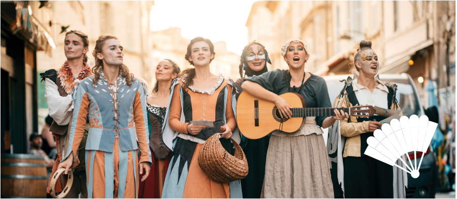
Les Fourberies de Scapin 2023