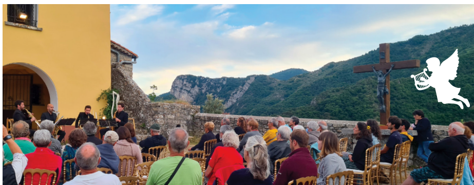
Spectacle à Notre Dame de la Menour à Moulinet