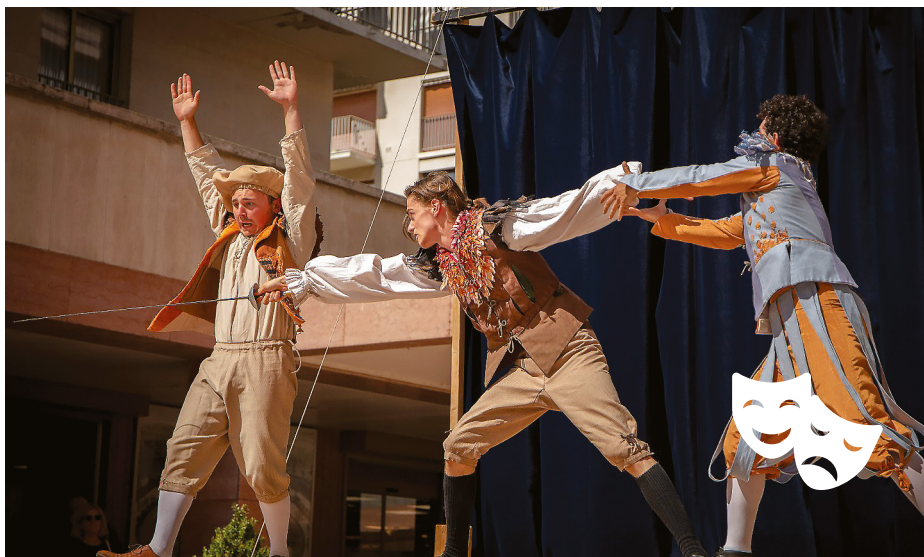
Les Fourberies de Scapin 2023